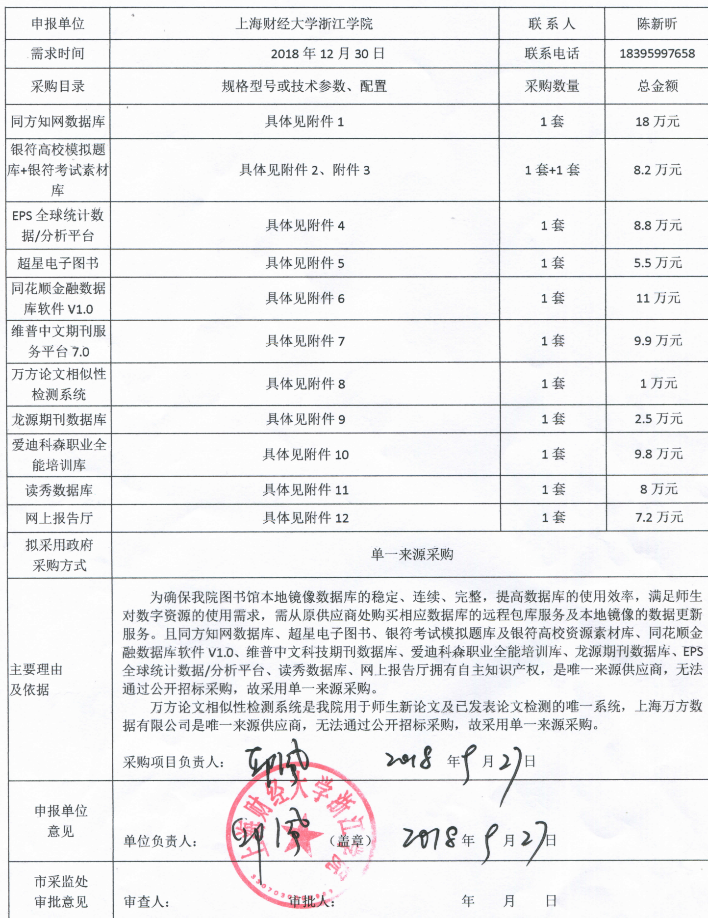
政府采购方式审批表